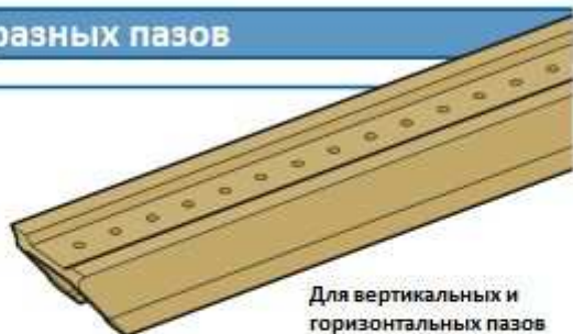
Для вертикальных и горизонтальных пазов

Содержание пазов в чистоте и слив СОЖ повышают комфорт работы с оборудованием.