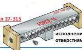
исполнение с резьбовыми отверстиями