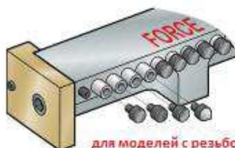
для моделей с резьбовыми отверстиями в нажимных поршнях